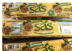
Foto y características orientativas , comprobar siempre etiquetado del producto recibido

FRUTA MARACUYA PULPA ESTUCHE 230 GR MANTENER A -18°C ORIGEN: COLOMBIA INFO NUTRICIONAL 100GR: valor energetico 251kj/60kcal grasa 0,18gr, saturada 0,015gr, monoinsaturado 0,022gr poliinsaturado 0,106gr, hidra carbono 14,45gr, azucar 14,25gr fibra alimentaria 0,2gr, proteina 0,67gr, sal 6mg. Esta información debe contrastarse siempre Con la etiqueta del producto adquirido.