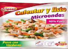
Foto y características orientativas , comprobar siempre etiquetado del producto recibido

SALTEADO PAVO/VERDURA FRIPOZO 400 GR MANTENER A -18°C NO RECONGELAR ORIGEN: ESPAÑA ALERGENOS: SOJA, LECHE ,HUEVO, APIO.INGRED:fiambre pavo (40%) agua, fecula patata, proyeina soja/leche, azucar,dextrosa maiz, aromas estabil (trifosfato sorbitol carrageno), antiox (eritorbato sodico acido citrico citrato sodio) coloran (acido carminico),judias verdes, zanahoria, cebolla, berenjena frita, aceite vegetal/girasol.INFO NUTRICIONAL 100GR: valor energetico 273kj/8400kcal grasa 2,3gr, saturada 0,5gr, hidra carbono 3,1gr, azucar 2,8gr, proteina 7,2gr sal 1,1gr.Esta informacion debe contrastarse siempre con la etiqueta Del envase adquirido.