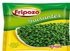
Foto y características orientativas , comprobar siempre etiquetado del producto recibido