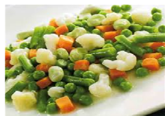
Foto y características orientativas , comprobar siempre etiquetado del producto recibido

MENESTRA VERDURAS FORMATOS BOLSA 1 KG o 2.5 KG MANTENER A -18°C ORIGEN ESPAÑA INGRED: ZANAHORIA, GUISANTE, COL BRUSELAS, COLIFLOR, JUDIA TROCEADA. INFO NUTRICIONAL 100GR: valor energetico 197kj/47kcal grasa 0,3gr, saturada 0,1gr, hidra carbono 6,9gr, azucar 4,2gr proteina 2,6gr, sal 0,04gr. Esta información debe contrastarse siempre Con la etiqueta del producto adquirido.