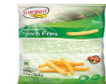
Foto y características orientativas , comprobar siempre etiquetado del producto recibido