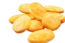
Foto y características orientativas , comprobar siempre etiquetado del producto recibido