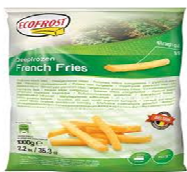
Foto y características orientativas , comprobar siempre etiquetado del producto recibido