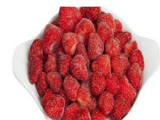
Foto y características orientativas , comprobar siempre etiquetado del producto recibido

FRUTA FRESA FORMATOS BOLSA 1 KG o 2.5 KG MANTENER A -18°C. NO RECONGELAR. ORIGEN: ESPAÑA INFO NUTRICIONAL 100GR: valor energetico 137kj, grasa 0,4gr, saturada 0gr, hidra carbono 6,7gr, azucar 6,6gr, fibra alimentaria 1,3gr, proteina 0,8gr.