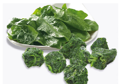
Foto y características orientativas , comprobar siempre etiquetado del producto recibido