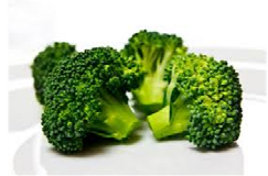
Foto y características orientativas , comprobar siempre etiquetado del producto recibido

BROCOLI k500 FORMATOS BOLSA 500 GR o 1KG o 2.5KG MANTENER A -18°C ORIGEN: BELGICA INFO NUTRICIONAL 100GR : valor energetico 119kj/28kcal grasa 0,4gr, saturada 0,1gr, hidra carbono 1,8gr, azucar 1,5gr, proteína 3,0gr, sal 0,03gr. Esta informacion debe contrastarse siempre Con la etiqueta del producto adquirido.