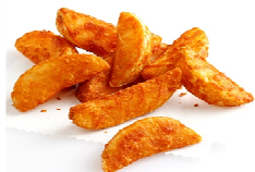
Foto y características orientativas , comprobar siempre etiquetado del producto recibido