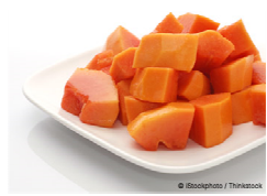
Foto y características orientativas , comprobar siempre etiquetado del producto recibido