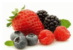
Foto y características orientativas , comprobar siempre etiquetado del producto recibido

FRUTA BOSQUE FORMATOS BOLSA 1KG o 2.5KG MANTENER A -18°C ORIGEN: POLONIA INGRED: grosella negra 5%, mora 5%, arandano 5%. INFO NUTRICIONAL 100GR :valor energetico 177kj/42kcal grasa 0gr, saturada 0gr, hidra carbono 11,3gr, azucar 6,2gr proteina 0,8gr, sal 0,01gr. Esta información debe contrastarse siempre Con la etiqueta del producto adquirido.