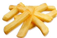
Foto y características orientativas , comprobar siempre etiquetado del producto recibido