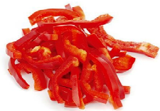
Foto y características orientativas , comprobar siempre etiquetado del producto recibido

PIMIENTO ROJO TIRAS k500 FORMATOS BOLSA 1 KG o 2.5 KG MANTENER A -18°C ORIGEN: ESPAÑA INFO NUTRICIONAL 100GR:valor energetico 153kj/36kcal grasa 0,4gr, saturada 0,1gr, hidra carbono 6,4gr, azucar 6,1gr, proteina 1,0gr, sal 0,1gr.Esta informacion debe contrastarse siempre Con la etiqueta del producto adquirido.