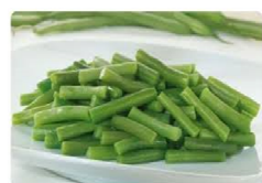
Foto y características orientativas , comprobar siempre etiquetado del producto recibido