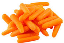
Foto y características orientativas , comprobar siempre etiquetado del producto recibido

ZANAHORIA BABY k500 FORMATOS BOLSA 500 GR o 1 KG o 2.5 KG MANTENER A-18°C ORIGEN: ESPAÑA INFO NUTRICIONAL 100GR:valor energetico 144kj/34kcal grasa 0gr, saturada 0gr, hidra carbono 6,7gr, azucar 6,5gr proteina 0,4gr, sal 4mg.Esta informacion debe contrastarse siempre Con la etiqueta del producto adquirido.