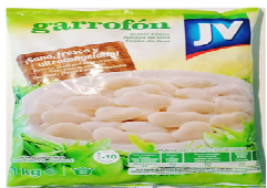
Foto y características orientativas , comprobar siempre etiquetado del producto recibido