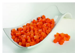
Foto y características orientativas , comprobar siempre etiquetado del producto recibido