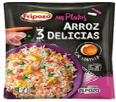
Foto y características orientativas , comprobar siempre etiquetado del producto recibido

ARROZ 3 DELICIAS suelto FORMATOS 1KG Y 2.5 KG ORIGEN:ESPAÑA MANTENER A -18°C NO RECONGELAR ALERGENOS: crustaceos, huevo, leche, gluten, sulfitos. INGREDIENTES: arroz, zanahoria, guisantes, agua, cerdo, patata, huevo, harina, proteína leche, estabil( 407-e450, E401), antiox (metabisulfito sodico), gamba aceite girasol, aromas, endurecedor( E516), colorante( E120), tortilla, y acidulante(E330) Uso: descongelar y consumir frío o caliente. INFO NUTRICIONAL 100GR: valor energetico 398kj/94kcal grasa 1,1gr, saturada 0,4gr, hidra carbono 15gr, azucar 1,3gr, proteína 5,2gr, sal 0,55gr. Esta informacion debe contrastarse con la etiqueta del envase adquirido